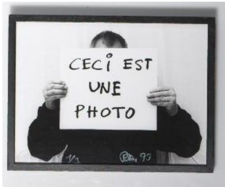
BEN présente des œuvres dans l'esprit de son exposition « Les limites de la photographie » au musée de Mougins.